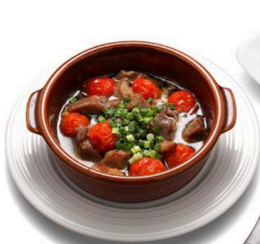
かしらとプチトマトのアヒージョ