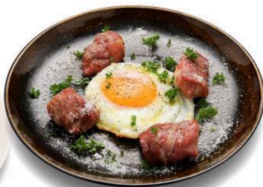
生ハムとモッツアレラのビスマルク風