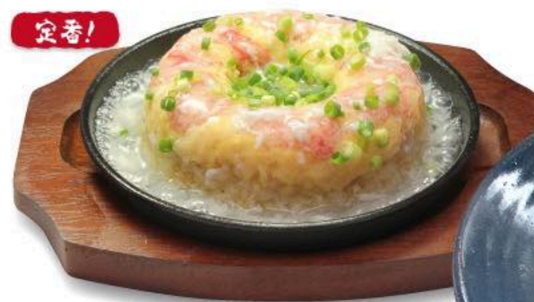
鉄板カニあんかけ炒飯