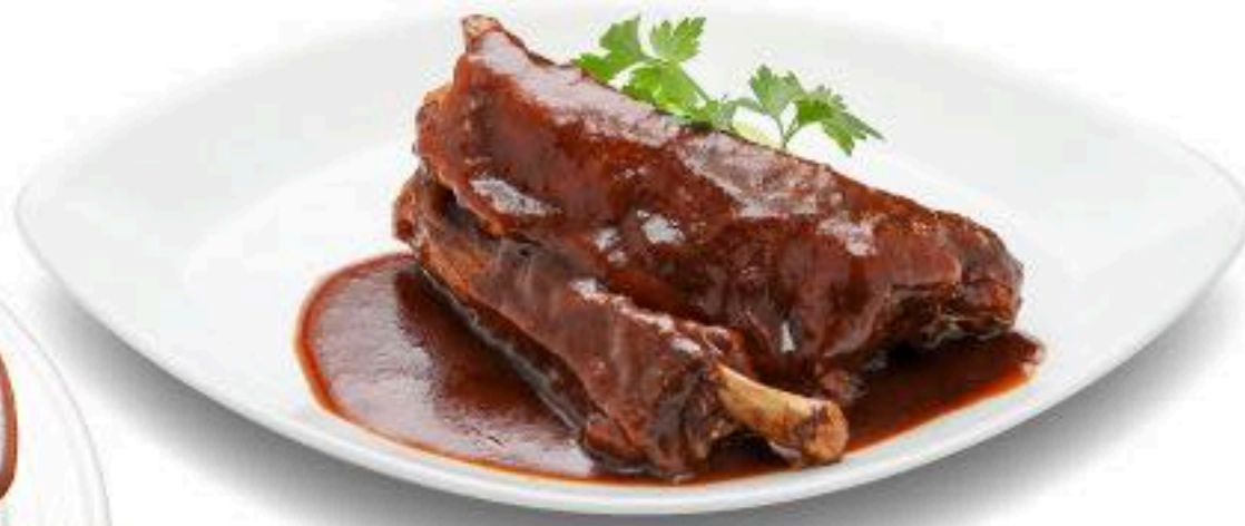
スペアリブのマルサラ酒とテンメン醬ソース