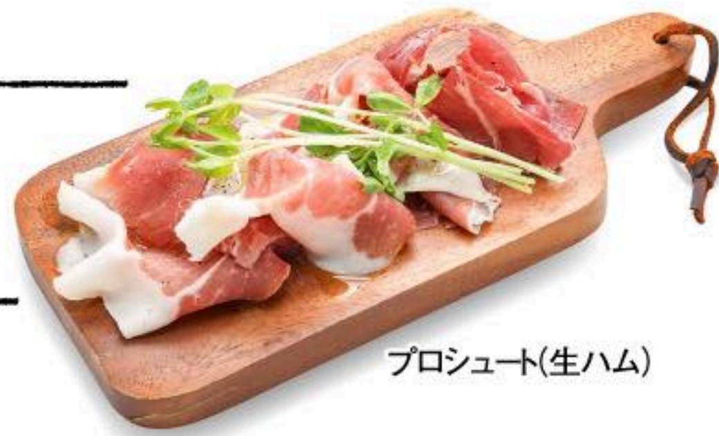
プロシュート(生ハム)