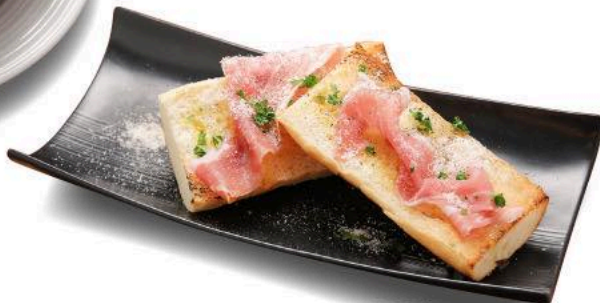
ガーリックトースト生ハムのせ