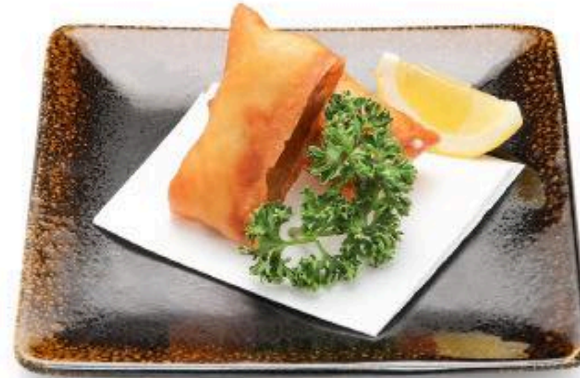
笑子豚のチーズ春巻