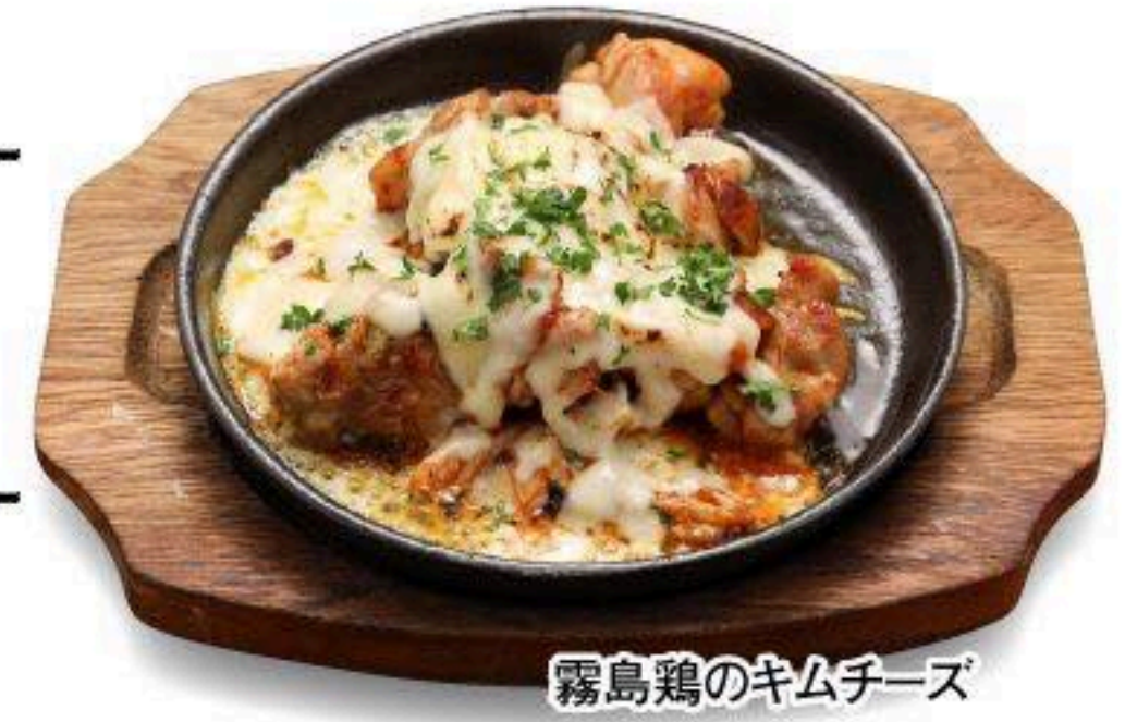
霧島鶏のキムチーズ