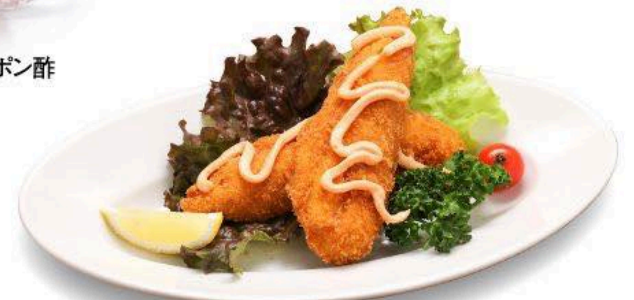
ササミのチーズ揚げ