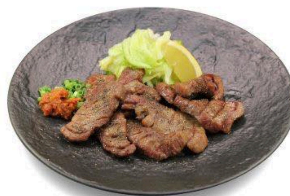
炭之助厚切り牛タン