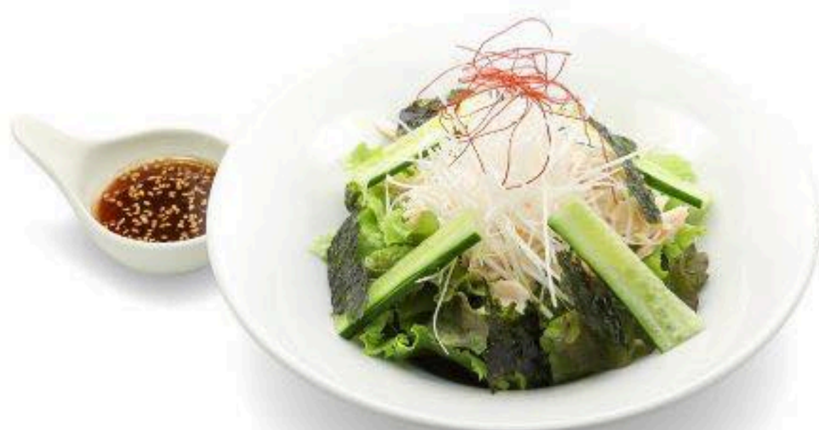
ささみのチョレギサラダ