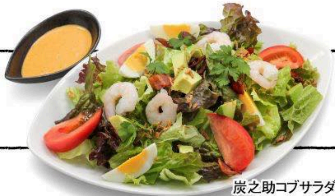
炭之助コブサラダ