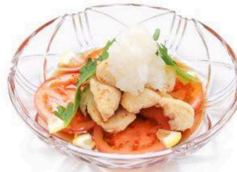
ボンジリとトマトのおろしポン酢